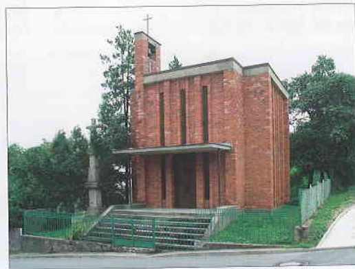
Kaple sv. Václava ve Zlíně-Kudlově