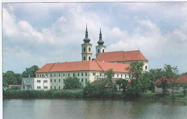
Bazilika Panny Marie Sedmibolestné v Šaštíně

besedy bude rovněž poskytnut dostatečný prostor k dotazům, souvisejícími s tématem Policie ČR či bezpečnosti.