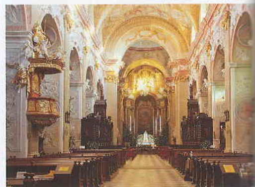
Interiér baziliky

svědkové víry 20. století. Nechybí v ní ani zlatá růže, kterou velehradské bazilice daroval papež sv. Jan Pavel II. Mimochodem, v zahradě gymnázia roste lípa, kterou tento papež zasadil při své návštěvě v roce 1990. „Zlaté růže i lípy si velmi považujeme,“ podotýká správce místní farnosti