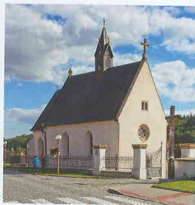
Kaple „Cyrilka“