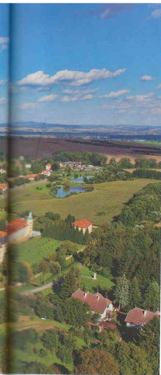
Pohled na Velehrad