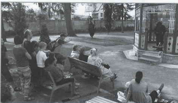
Loutkový koncert v rámci Víkendů otevřených zahrad.