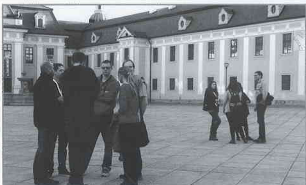
Účastníci Studentského Velehradu na nádvoří před bazilikou.