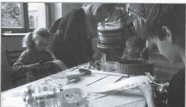
Výtvarná dílna při první části Noci kostelů