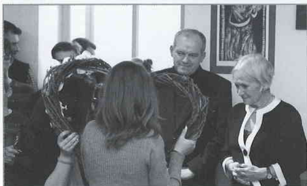
Z vernisáže výstavy Karel IV - Otec vlasti.