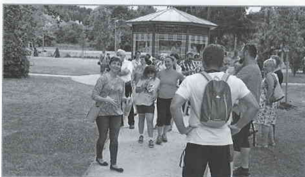
Prohlídka barokních zahrad.