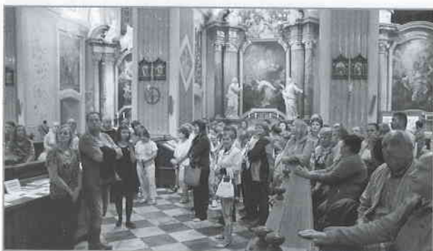
Noc kostelů 2016.

Svatá brána otevřená, zlatým klíčem odemčená, kdo tou branou projde, k Ježíšovi dojde. Ať jsi ten anebo ten, staň se Božím dítětem.